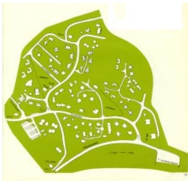
Situasjonsplan for boligutstillingen

This first housing exhibition consists of 25 projects with a total of 85 dwellings. The character and content vary, and include experimental one-family detached houses, ordinary groups of houses and a collective, which is described on the next page. Recurring themes are energy saving, winter gardens and flexible solutions. There are also some experimental projects which today can be said to lie rather outside what is of interest to the housing sector.