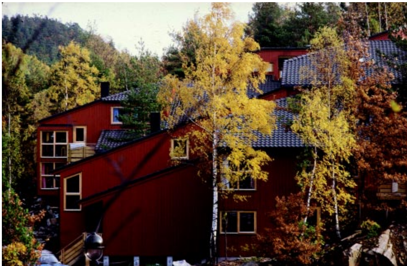
Bofelleskap, Hånes.