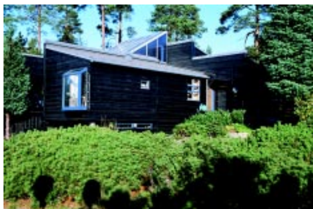
Enebolig; Torp as arkitekter MNAL.

A collective designed by the architects Knutsen and Løvdahl. The project was designed to show an alternative to the detached one-family house and consist of five family houses with an area not exceeding the limits set by the State Housing Bank. Each family has 100 m 2 of its own, while an additional 200 m 2 is set aside for joint use, with hobby room, activity room, wash room, common room with fireplace and kitchen/dining room.